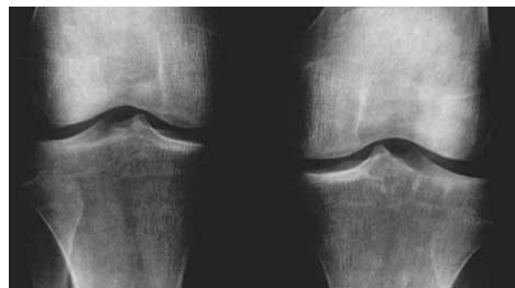
Imagen radiográfica de las rodillas, que muestra una típica 'gonartrosis' que no causó dolores intra-articulares, pero sí severos dolores peri-articulares.

extraarticular, muy doloroso, que lamentablemente se confunde con dolor intraarticular y lleva a menudo a cirugía prematura, y en muchas ocasiones injustificada.